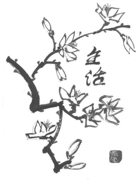
Магнолии с йероглиф за диво цвета