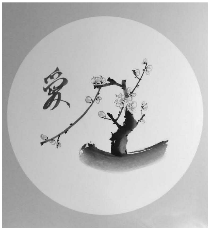
Цъфнала слива бонсай с йероглифът любов